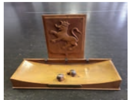
Trophée du concours « Le Corzéen »