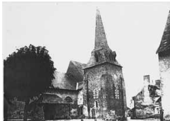
Document Camille GIRARDEAU (1)