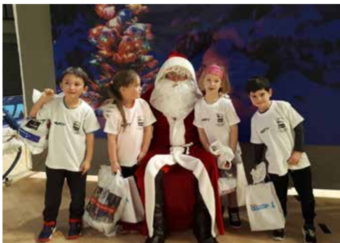
La venue du Père Noël