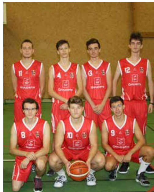
L'équipe des U20