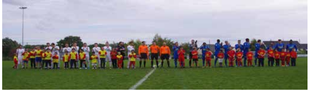
5ème tour de Coupe de France contre Fontenay (nationale 3) en novembre 2019 avec les enfants de l'école de football.

Le club de football de PELLOUAILLES CORZÉ est fier de compter 320 licenciés pour cette saison 2019/2020.