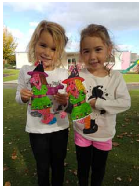
Réalisation de «pantins sorcières»

Concernant les ateliers de cette rentrée, diverses activités ponctuent la semaine des enfants, du bricolage au sport, les équipes essaient de trouver le juste milieu entre le besoin pour l'enfant de lâcher prise et la volonté de proposer des activités de découverte, le tout sur un temps court de préparation et d'activités avec les enfants.