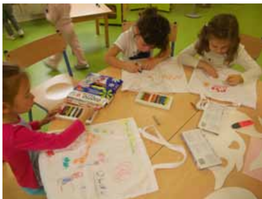
Réalisation de sacs à comptines

Nous vous invitons à participer à ce projet citoyenneté ; nous collectons les gourdes de compotes pour l'association «Ensemble pour Baptiste». Cette revalorisation des déchets permet de reverser à l'association une participation, qui permettra l'achat de matériel ou le financement d'activités pour Baptiste, petit garçon touché par le syndrome d'Angelman. Vous pouvez les déposer à l'accueil périscolaire du soir (en maternelle), chargé de la collecte.