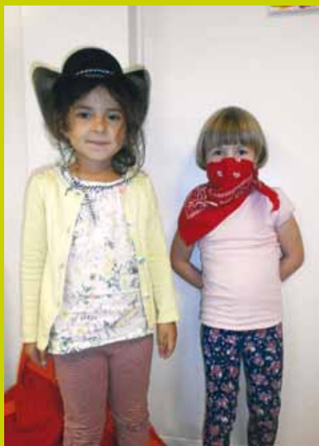
Photos Accueil de Loisirs