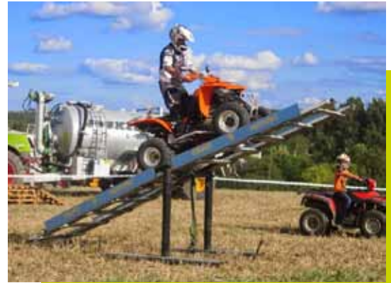
Démonstration lors d'une manifestation

QUAD 9 MOTORS vous présente ses meilleurs vœux pour 2016.