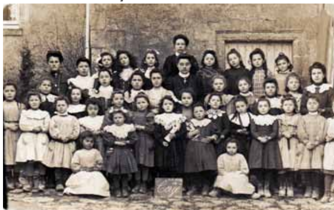
Classe de fillettes de Corzé en 1910