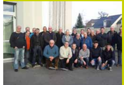
Conseil d'administration et pêcheurs -CA du 19 décembre 2015