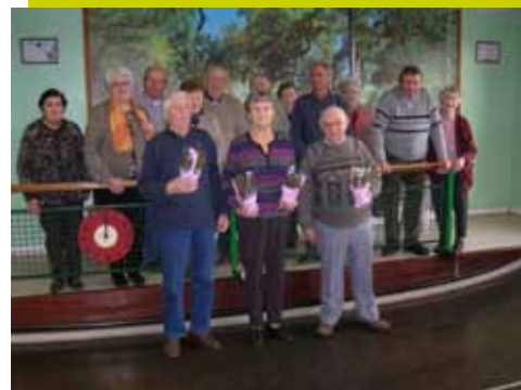
Finale du Challenge Communal

Si vous êtes intéressés par le jeu de la boule de fort, nous sommes prêts à vous accueillir. Vous serez les bienvenus.