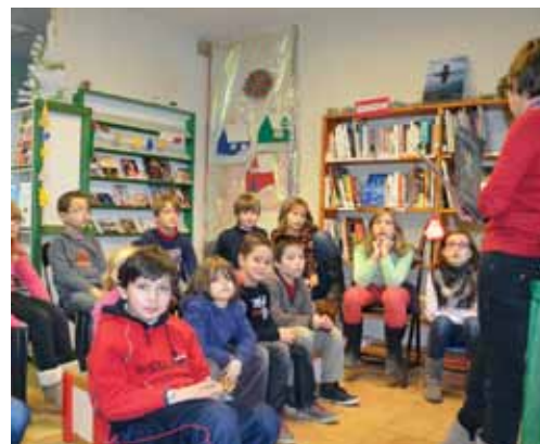
L'heure du conte de Noël