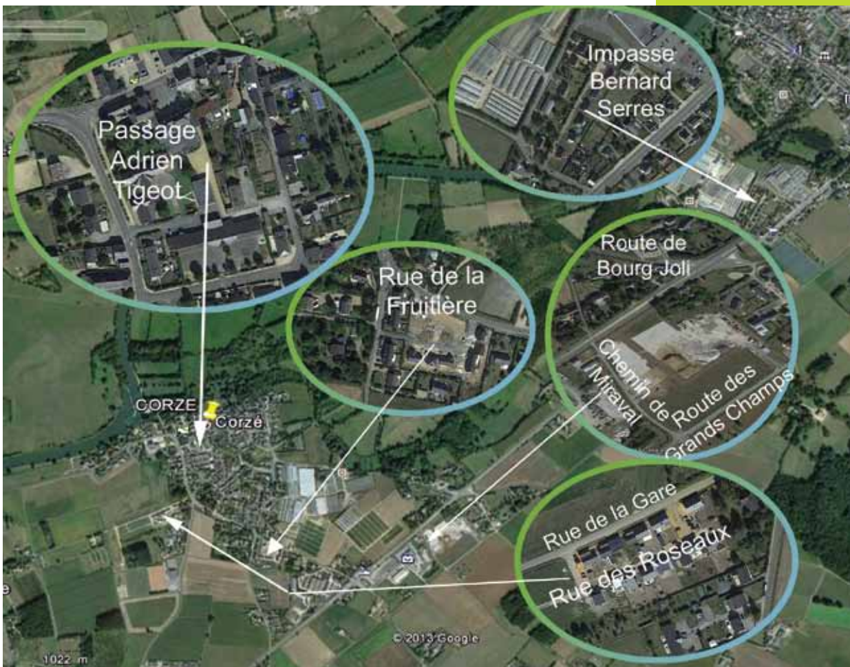
Photomontage Rodolphe PIVERT