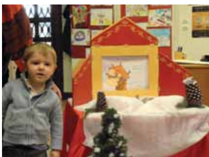
Visite du RAM à la bibliothèque

En juin et décembre : accueil des enfants du RAM