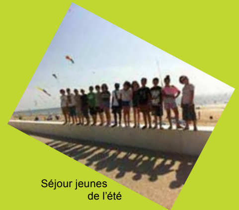
Séjour jeunes de l'été

Pendant les périodes scolaires, l'accueil est ouvert les mercredis et samedis de 14h à 19h et les vendredis de 17h à 21h.