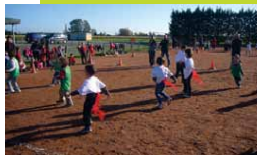
Rencontre jeux collectifs cycle 2

L'équipe enseignante au grand complet et tous les élèves de l'École Adrien TIGEOT vous souhaitent une bonne année 2014 !