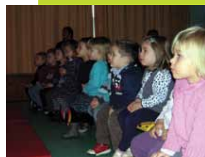
Spectacles de Noël